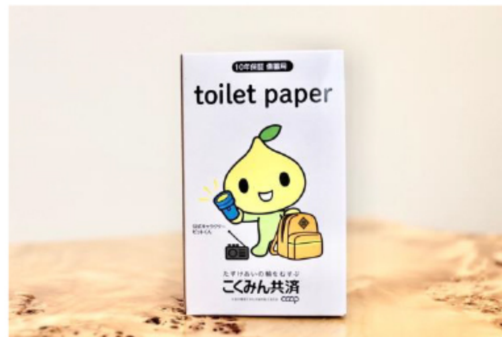
こくみん共済 coop さま